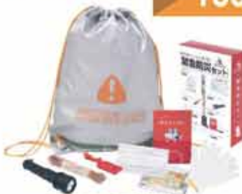
緊急防災セット (8点セット)