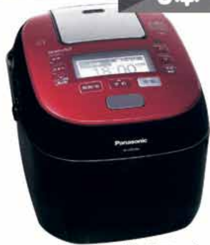
【パナソニック】炊飯ジャー ※実際の色とは異なる場合があります (SR-SPX105)