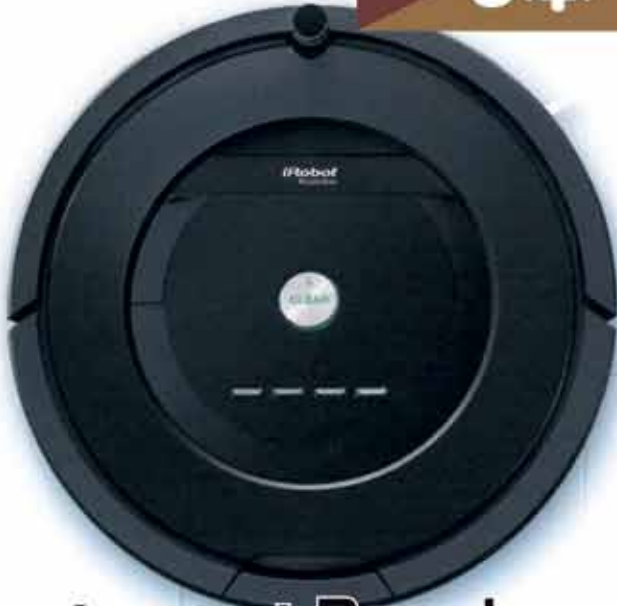
【i Robot】Roomba (R885060)