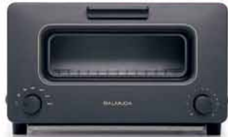
【BALMUDA】トースター ※実際の色とは異なる場合があります (K01A)