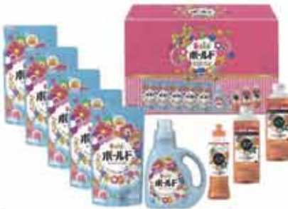
【P&G】 ボールド 香りのセット (9点セット)