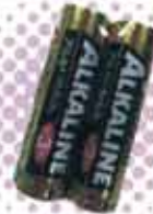
アルカリ 乾電池 単3または単4 (2本入)