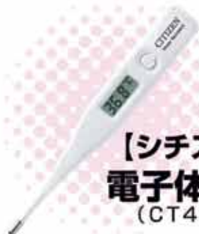
【シチズン】 電子体温計 (CT422)