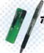
ボールペン または ライター